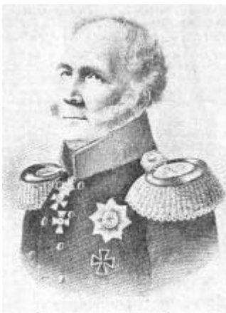
Generalfeldmarschall Hermann von Boyen Nach einer Zeichnung Hermine von Boyen

Die Schaffung einer europäischen Verteidigungsarmee, der deutsche Wehrbeitrag und die Organisation der internationalen Streitkräfte haben in diesen Wochen zu lebhaften Diskussionen geführt und viele Konferenzen und Beschlüsse ausgelöst. In diesem Zusammenhang verweisen wir auf das Werk eines großen ostpreußischen Soldaten, des Generalfeldmarschalls von Boyen, das ein Jahrhundert Bestand hatte.