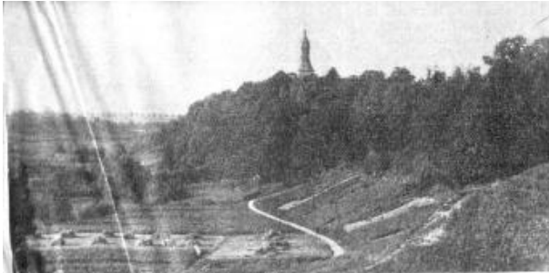
Blick vom Schloßberg auf Kreuzburg Der Turm der Stadtkirche lugt über hohe Baumwipfel empor.