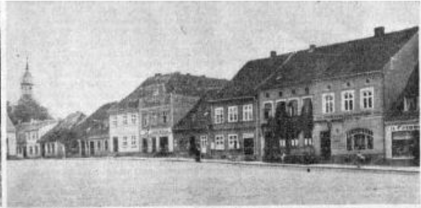
Häuserzeile am Marktplatz von Kreuzburg Der Heimatort des „ ohlen Rieckermann “ ( Reichermann ) war ein stilles Landstädtchen.

Vor der Einmündung des Keyster in den Pasmare erheben sich hohe Steilufer. Auf diesen baut sich die Stadt Kreuzburg terrassenförmig auf. Der hochgelegene Kirchturm der Stadt schaut weit ins Natanger Land; im Hintergrund heben sich die Umrisse des Waldes von Kilgis ab. Betrachtete man vom Philosophenweg die kleinen malerischen Häuschen der Grundstraße, die aus den Trümmern der alten Ordensburg erbaut sein sollen, so konnte einem der Gedanke kommen, sie seien an den Berg geklebt.