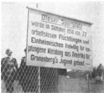
Ein Sportplatz aus Dank